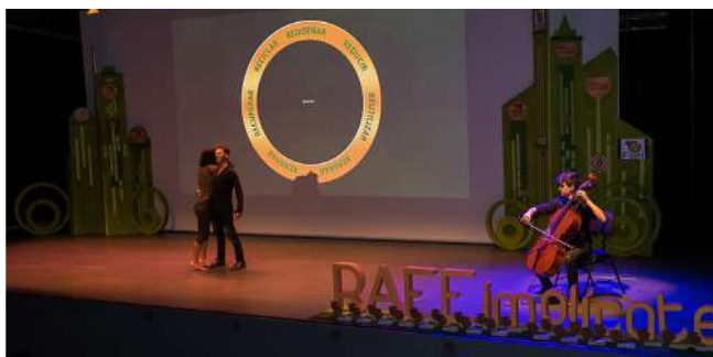
Imagen de la representación artística del evento.