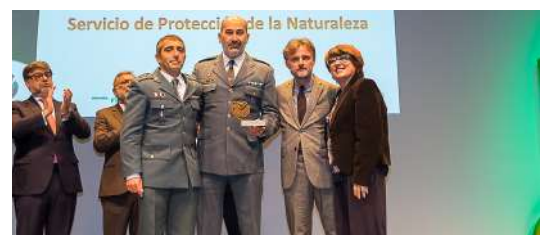
Momento de la entrega del galardón a SEPRONA