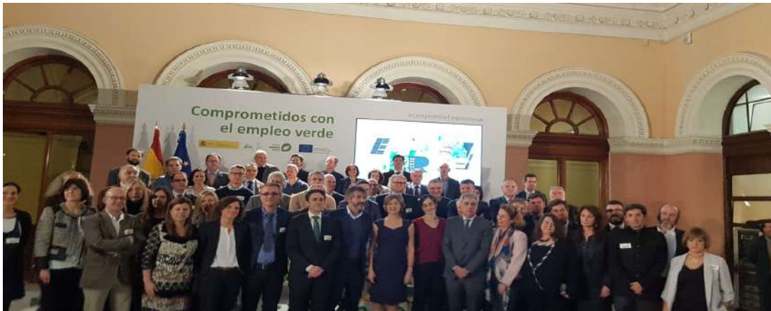
Imagen de clausura del acto “Comprometidos con el empleo verde” celebrado en Madrid.

Se trata de acciones completamente gratuitas para los beneficiarios, cofinanciadas por el FSE en un 77,69%, formativas y de asesoramiento, dirigidas a personas trabajadoras del Sector de la distribución del Electrodoméstico y Otro Equipamiento del Hogar, para mejorar su adaptación al mercado, aumentando sus competencias en temas demandados por la transición a una economía verde, concretamente en el campo de la reducción, reutilización y reciclaje de RAEE (Residuos de Aparatos Eléctricos y Electrónicos), y de esta manera conseguir formación y un empleo de calidad.