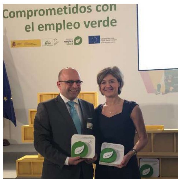
El Secretario General de FAEL junto a la Ministra de Agricultura y Pesca, Alimentación y Medio Ambiente

Al objeto de materializar dicho compromiso, se ha hecho entrega a los representantes de las entidades beneficiarias, para su firma, de una pieza que contiene el compromiso adquirido por cada uno de ellos con el empleo verde. El compromiso adquirido por parte de AAEL dentro de este proyecto "Empleaverde mejora" del que ha resultado beneficiaria es el de "Formar a más de 1.000 trabajadores en la reducción, reutilización y reciclaje de aparatos eléctricos y electrónicos" . Se trata de acciones completamente gratuitas para los beneficiarios, cofinanciadas por el FSE, formativas y de asesoramiento, dirigidas a personas trabajadoras del Sector de la distribución del Electrodoméstico y Otro Equipamiento del Hogar, para mejorar su adaptación al mercado, aumentando sus competencias en temas demandados por la transición a una economía verde, concretamente en el campo de la reducción, reutilización y reciclaje de RAEE (Residuos de Aparatos Eléctricos y Electrónicos), y de esta manera conseguir formación y un empleo de calidad. Para la puesta en marcha de este proyecto, AAEL cuenta con la colaboración de ADEN, la Asociación Nacional de Empresas Distribuidoras de Electrodomésticos y, ASDINA, la Asociación Nacional de Diseño e Innovación aplicado al Emprendimiento, Pymes y Micropymes.