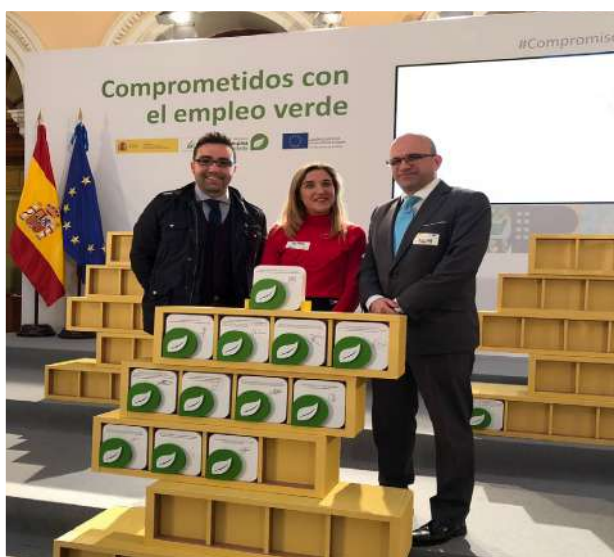
El Secretario General de FAEL junto a una Técnico de ADEN, y junto al Técnico de FAEL.

El acto ha sido presentado por la ministra de Agricultura y Pesca, Alimentación y Medio Ambiente, Isabel García Tejerina, y ha contado con un espacio para la visualización de los compromisos adquiridos por las entidades beneficiarias , entre las que se encuentra AAEL, de los 69 proyectos de la convocatoria del Programa "Empleaverde Mejora: REDUCCIÓN, REUTILIZACIÓN Y RECICLAJE DE RESIDUOS DE APARATOS ELÉCTRICOS Y ELECTRÓNICOS", presentado en la convocatoria de subvenciones del Programa empleaverde, gestionado por la Fundación Biodiversidad, del Ministerio de Agricultura y Pesca, Alimentación y Medio Ambiente, y cofinanciado por el Fondo Social Europeo (FSE) en el marco del Programa Operativo Empleo, Formación y Educación 2014-2020.